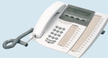
Dialog 4223 Professional digitales Telefon