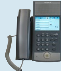
Dialog 5446 IP Premium IP-Telefon