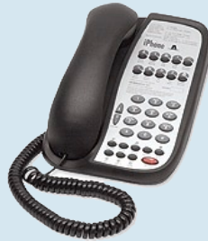
Teledex analoges Telefon