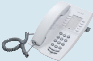
Dialog 4147 Medium analoges Telefon