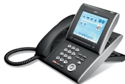
Ihre Zimmertelefone werden mit XML zu Schaufenstern mit Multimedia und Touch Screen Steuerung

Nutzen viele Ihrer Mitarbeiter bei der Arbeit Mobiltelefone? Wenn diese Handys durch DECT-Geräte ersetzt werden, entfallen die Kosten für die hotelinterne Kommunikation sowie hohe Handy-Gebühren.